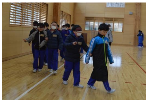
ガイドヘルプ体験