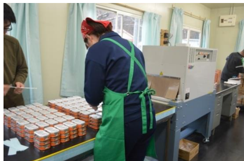
シュリンク包装機を使った作業

職員や利用者からは、「スピードの調整ができ、安全に作業ができる。」 「効率もよく、仕上がりもキレイ」との声が聞かれ、利用者の励みにつながっています。あたたかいご支援ありがとうございます。