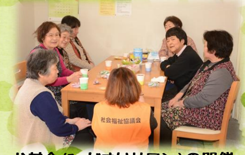
お茶会(ひだまりサロン)の開催