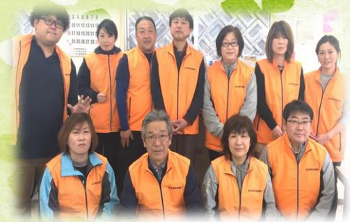
生活支援相談員11名です！ このメンバーでお伺いいたします