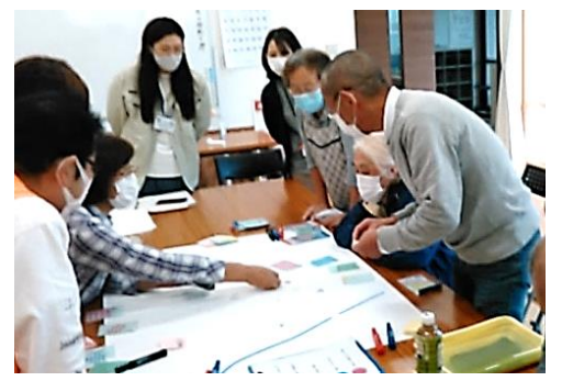
<支え合いマップ作成>