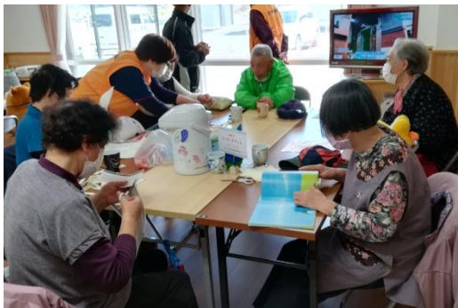
<地域見守り支援拠点 こ茶っこ>

大槌町生活支援相談員事業は、東日本大震災があった平成23年8月から開始し、10年目を迎えようとしています。今年度も、個別訪問による見守りや傾聴、地域のつながりを把握する「支え合いマップ」の作成のほか、地域見守り支援拠点「こ茶っこ」の運営、お茶っこの会の開催支援、ひだまりサロンの開催などを行います。どうぞ、お気軽に声をお掛けください。